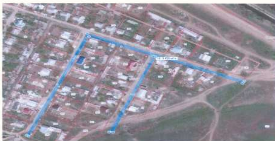
Схема расположения земельного участка Кадастровый квартал 34:03:160001

Расс сельс расп п.Но Ком Прив расп Мам Улит Белая