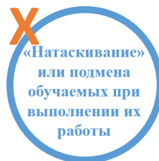
Рисунок 3 – Ошибки организаторов деловой игры