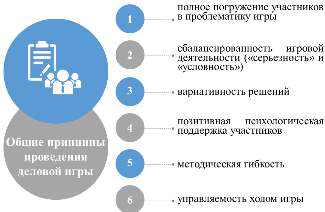
Рисунок 4 – Общие принципы проведения деловой игры

При проведении игры рекомендуется соблюдать следующие общие принципы (рисунок 4).